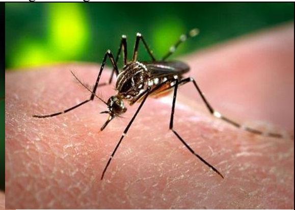
Gelbfiebermücke ( Aedes aegypti oder Stegomyia aegypti )