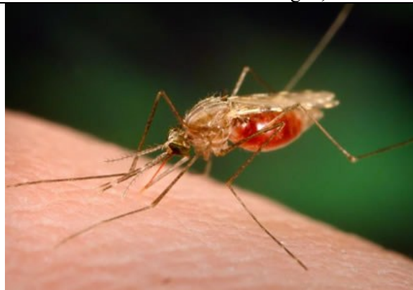
Malariamücke ( Anopheles spp.) in typischer Haltung bei der Blutmahlzeit

Viele andere Erkrankungen werden zusätzlich auch durch tagstechende Mücken wie z.B. Aedes -Mücken oder Sandmücken übertragen; darüber hinaus gibt es tag- und nachtaktive Insekten.