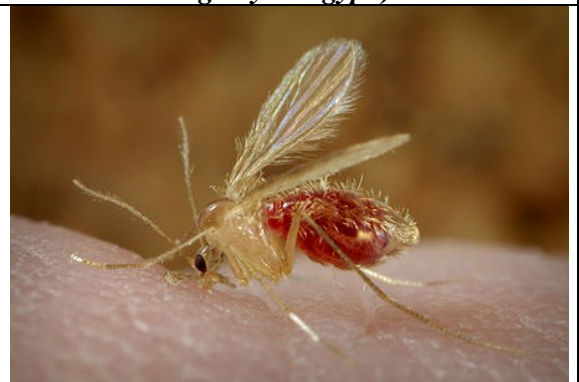
Sandmücke ( Phlebotomus papatasi ) bei der Blutmahlzeit