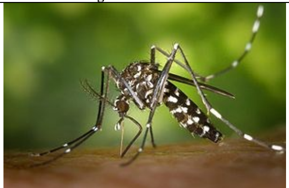
Asiatische Tigermücke ( Aedes albopictus oder Stegomyia albopicta )